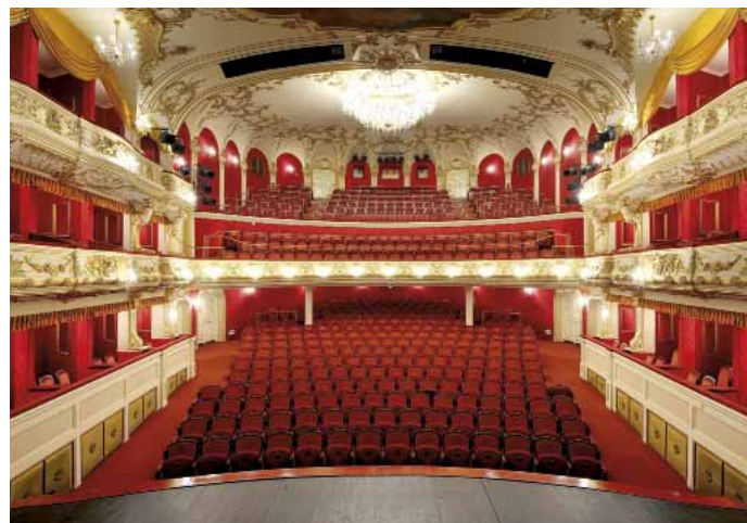
Divadlo Antonína Dvořáka

Informační centrum pro mladé cestovatele Výstaviště Černá louka Pavilon C1 Moravská Ostrava a Přívoz T +420 737 046 621 E useitostrava@cooltourova.cz